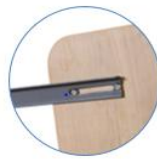
2 bras additionnels