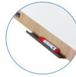
Porte stylo métallique