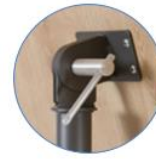
Système de rotation

Ne pas nettoyer avec un agent corrosif (alcool)