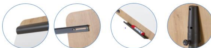
Serre-papier métallique 2 bras additionnels Porte stylo métallique Jonction plastique

Ne pas nettoyer avec un agent corrosif (alcool)